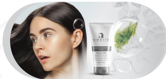
● Protein Treatment Mask

مقداری از شامپو را بر روی موی مرطوب ریخته و به آرامی ماساژ دهید و بعد از پنج دقیقه کاملاً آبکشی نمایید.