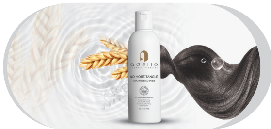
● Keratin Shampoo / No More Tangle