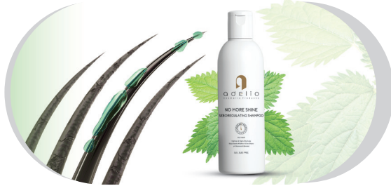
● Seboregulating Shampoo / No More Shine 200ml