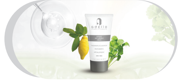
● Intense Anti-Wrinkle Cream

شبها بر روی پوست تمیز صورت و گردن به آرامی با حرکات دورانی به سمت بالا ماساژ دهید.