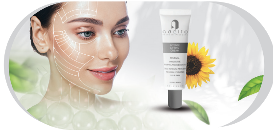
● Intense Lifting Cream