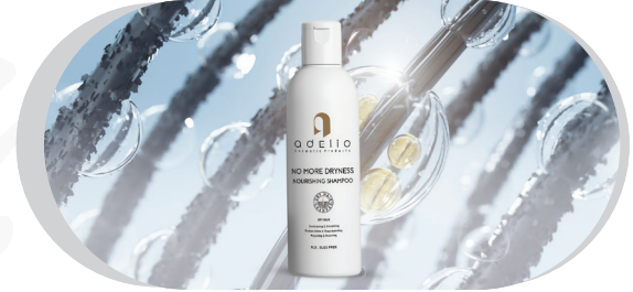
● Nourishing Shampoo / No More Dryness 200ml

به صورت روزانه مقدار مناسبی از شامپو را به مدت سه دقیقه بر روی کف سر و موها ماساژ دهید و سپس کاملاً آبکشی نمایید.